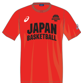
Tシャツのサンプル画像

※チームの状況により、エントリーされた選手が揃わない可能性もございます。 あらかじめご了承ください。