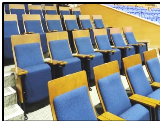
<アダストリアみとアリーナ、プレミアムシート 座席写真>